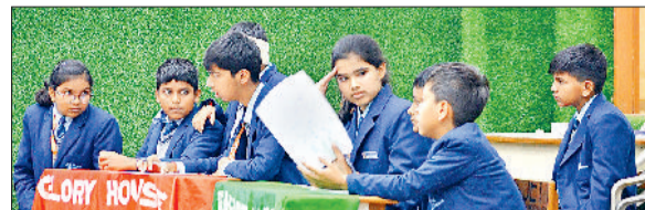
गन्नौर। गणित प्रश्नोत्तरी प्रतियोगिता में हिस्सा लेते छात्र।