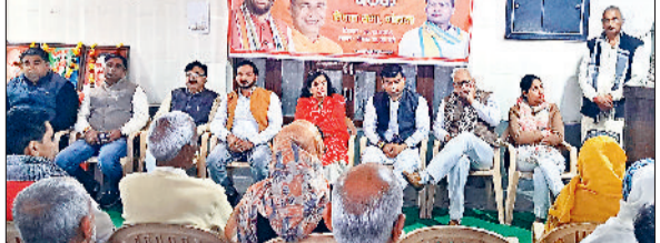
गोहाना। समारोह में अपने विचार व्यक्त करते हुए भाजपा नेता