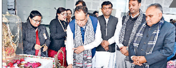
सोनीपत। जैन विद्या मंदिर में आयोजित कार्यक्रम का शुभारंभ करते हुए भाजपा प्रदेशाध्यक्ष, साथ में मेयर एवं अन्य।