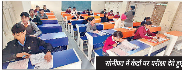
सोनीपत में केंद्रों पर परीक्षा देते हुए विद्यार्थी।